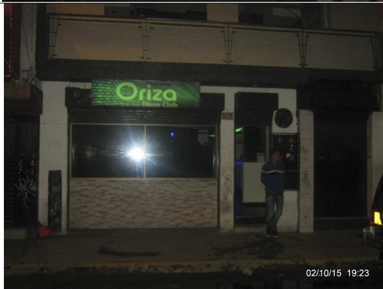
Fotografía No. 2: SONSAYONARA SALSA VIP , ubicado en la dirección Calle 6 Sur No. 71D - 25